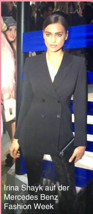
Irina Shayk auf der Mercedes Benz Fashion Week