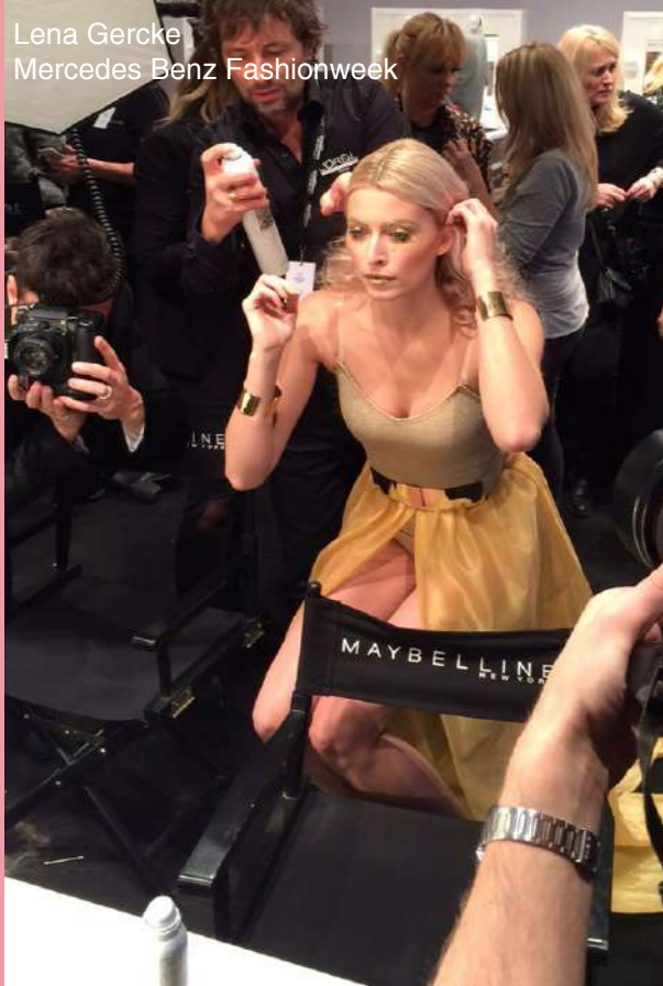
Lena Gercke Mercedes Benz Fashionweek