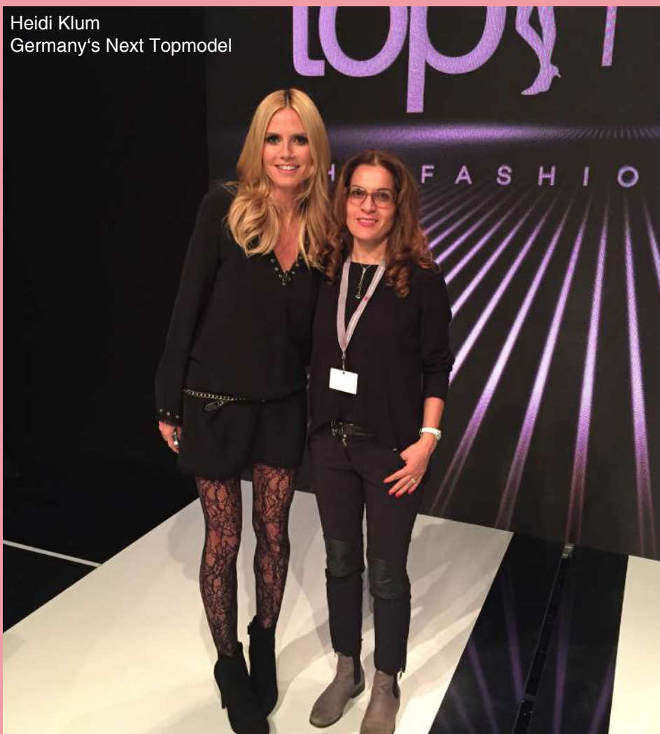
Heidi Klum Germany's Next Topmodel