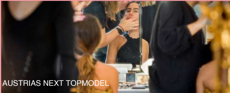
AUSTRIAS NEXT TOPMODEL