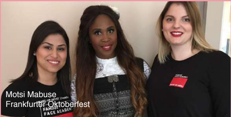
Motsi Mabuse Frankfurter Oktoberfest