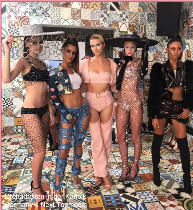
Dreharbeiten in der Karibik Germany's Next Topmodel