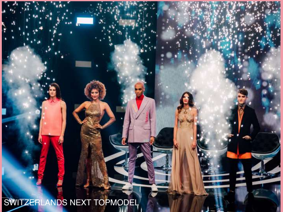
SWITZERLANDS NEXT TOPMODEL