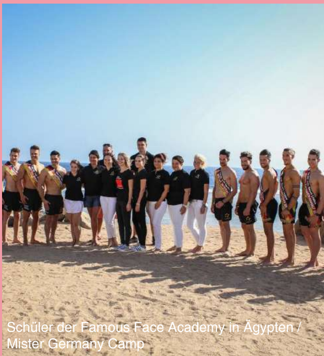
Schüler der Famous Face Academy in Ägypten / Mister Germany Camp