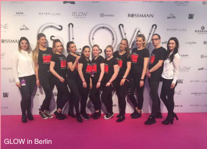
GLOW in Berlin