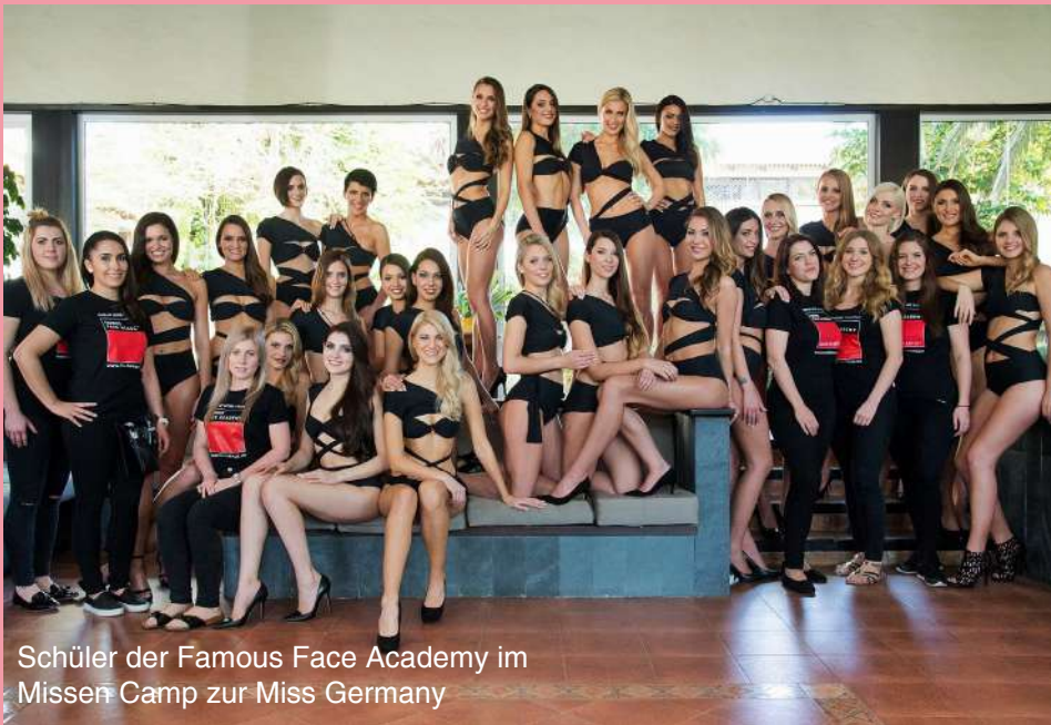
Schüler der Famous Face Academy im Missen Camp zur Miss Germany