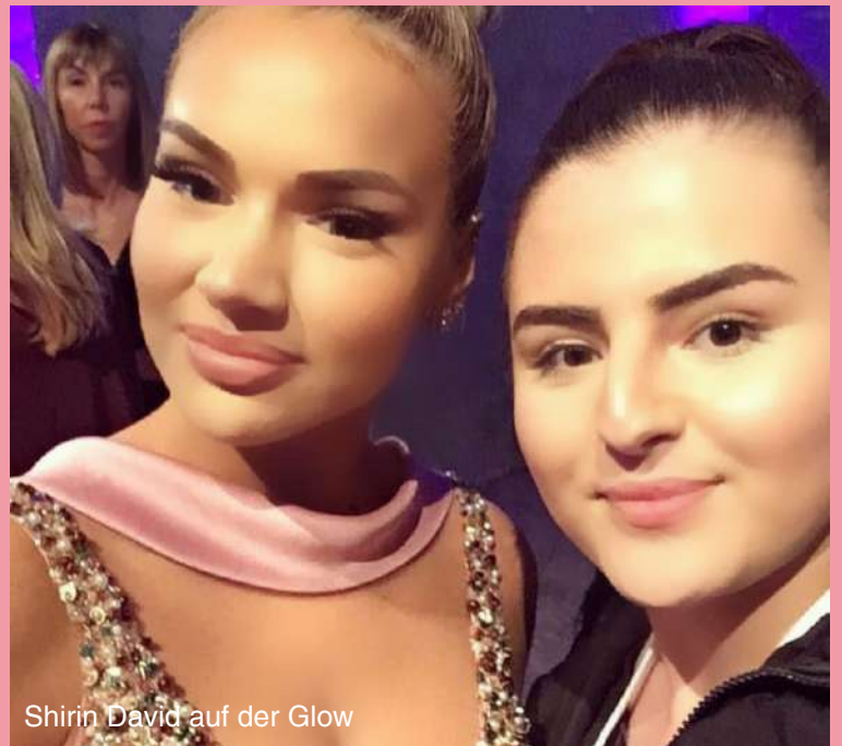
Shirin David auf der Glow