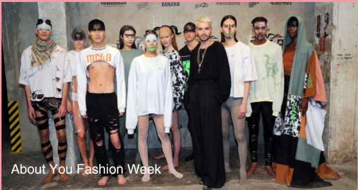
About You Fashion Week