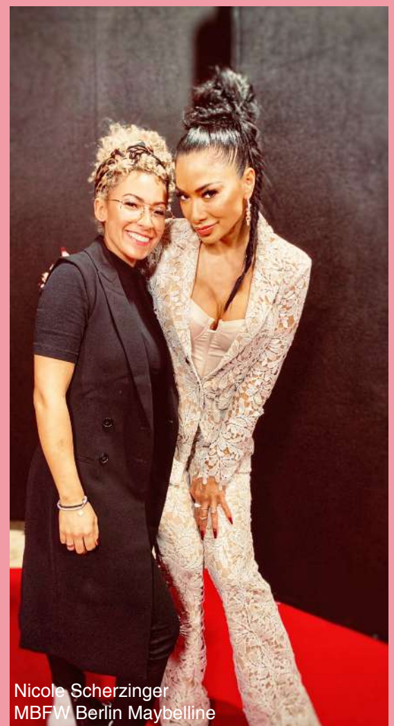
Nicole Scherzinger MBFW Berlin Maybelline