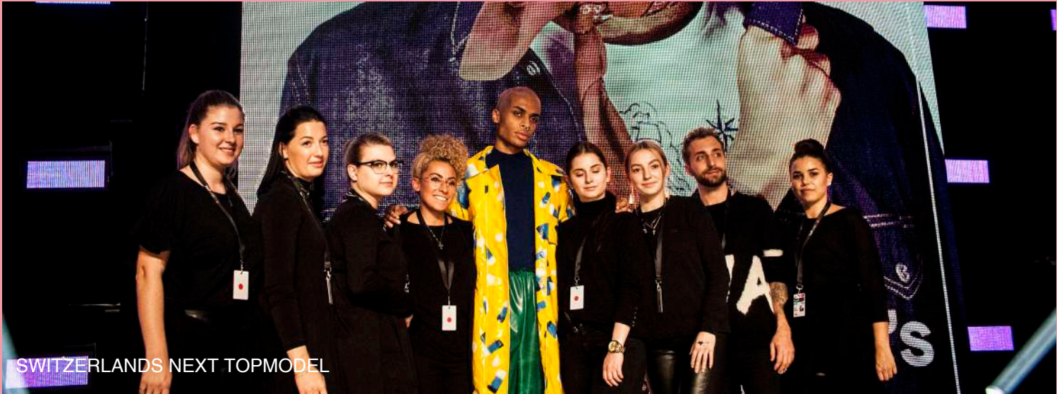
SWITZERLANDS NEXT TOPMODEL