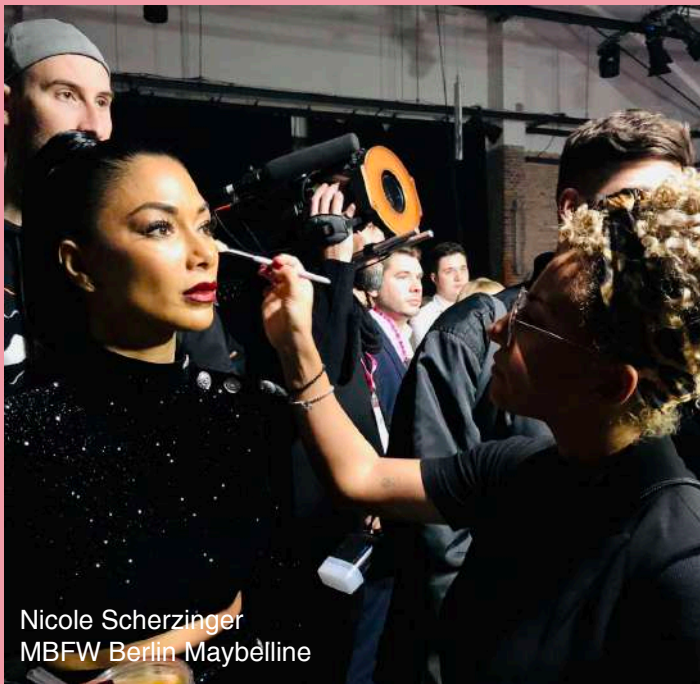
Nicole Scherzinger MBFW Berlin Maybelline