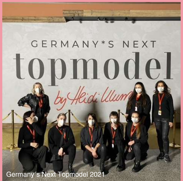
Germany's Next Topmodel 2021