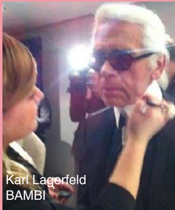
Karl Lagerfeld BAMBI