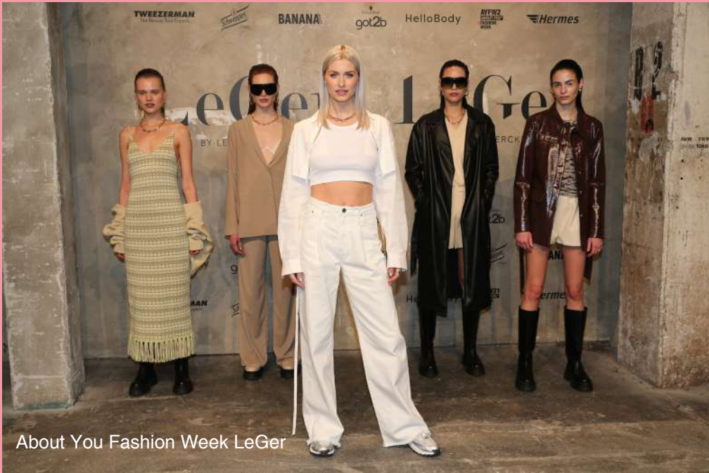
About You Fashion Week LeGer