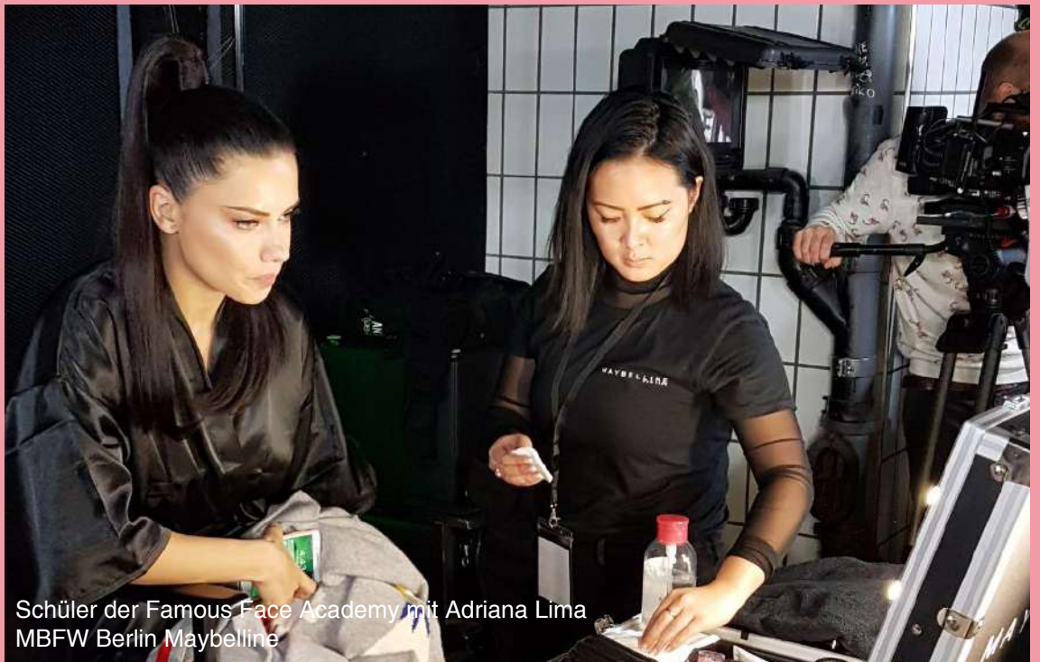
Schüler der Famous Face Academy mit Adriana Lima MBFW Berlin Maybelline