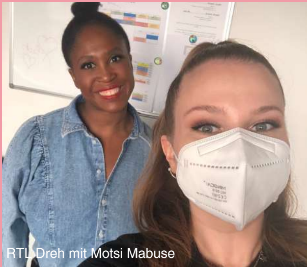
RTL Dreh mit Motsi Mabuse