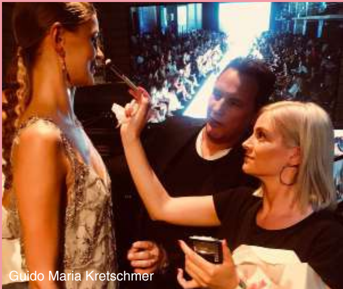
Guido Maria Kretschmer