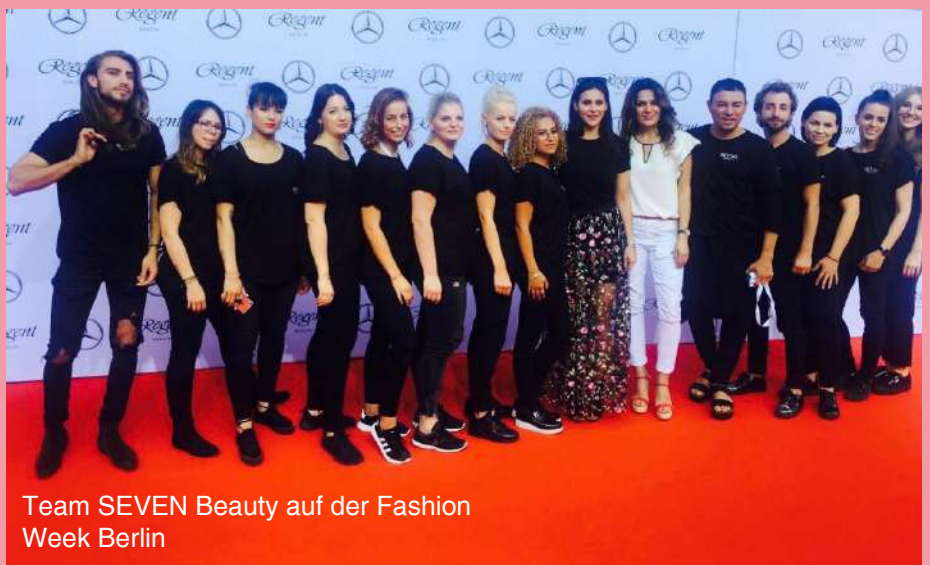
Team SEVEN Beauty auf der Fashion Week Berlin