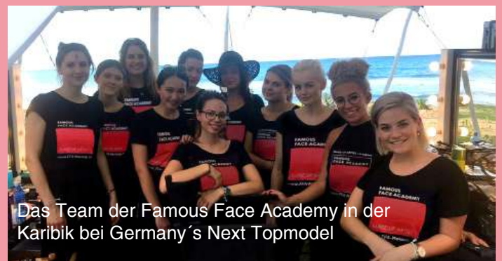
Das Team der Famous Face Academy in der Karibik bei Germany's Next Topmodel